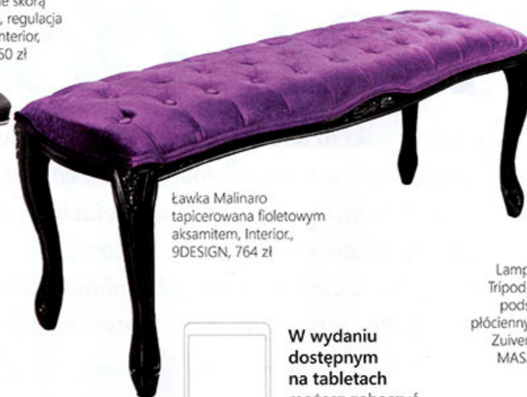
Ławka Malinaro tapicerowana fioletowym aksamitem, Interior, 9DESIGN, 764 zł