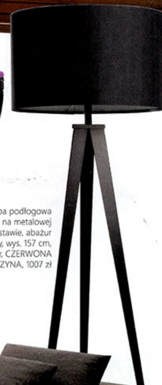
Lampa podłogowa Tripod na metalowej podstawie, abażur płócienny, wys. 157 cm, Zuiver, CZERWONA MASZYNA, 1007 zł