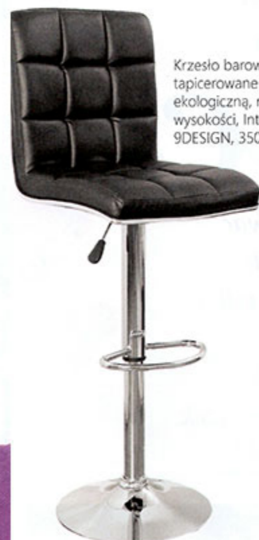
Krzesło barowe Mutina tapicerowane skórą ekologiczną, regulacja wysokości, Interior, 9DESIGN, 350 zł