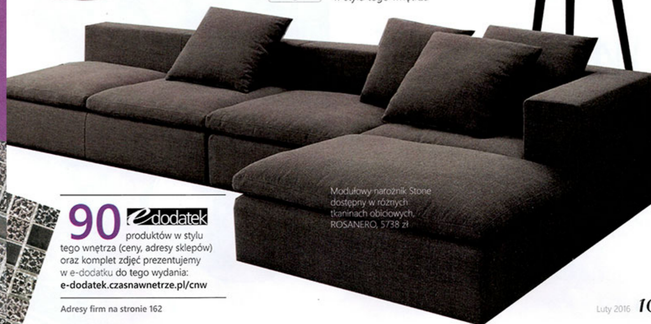
Modułowy narożnik Stone dostępny w różnych tkaninach obiciowych, ROSANERO, 5738 zł

90 e-dodatek produktów w stylu tego wnętrza (ceny, adresy sklepów) oraz komplet zdjęć prezentujemy w e-dodatku do tego wydania: e-dodatek.czasnawnetrze.pl/cnw