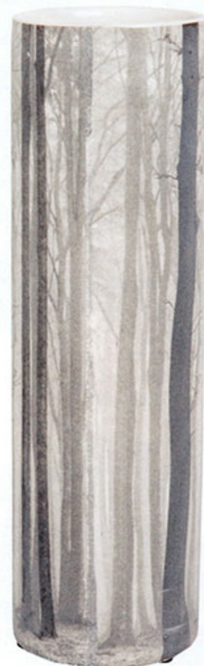
Ceramiczny wazon, wys. 29,5 cm, ZARA HOME, 89,90 zł