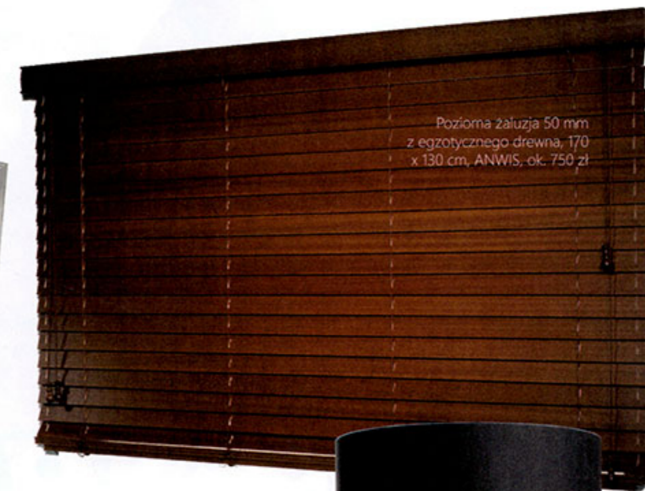
Pozioma żaluzja 50 mm z egzotycznego drewna, 170 x 130 cm, ANWIS, ok. 750 zł

W wydaniu dostępnym na tabletach możesz zobaczyć więcej przedmiotów w stylu tego wnętrza