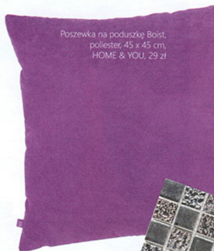
Poszewka na poduszkę Boist, poliester, 45 x 45 cm, HOME & YOU, 29 zł