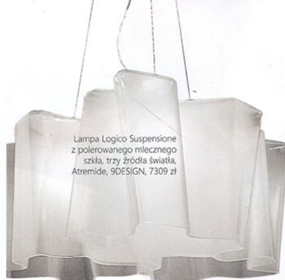
Lampa Logico Suspensione z polerowanego mlecznego szkła, trzy źródła światła, Artemide, 9DESIGN, 7309 zł